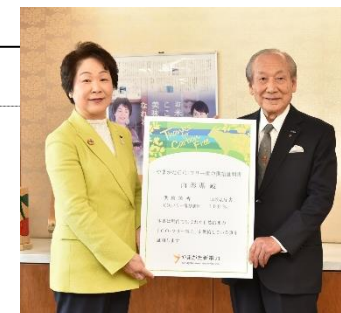
および「山形県企業局水道施設」へCO 2 フリー電力供給開始